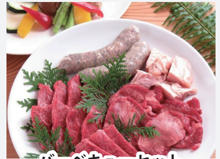
バーベキューセット