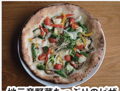
地元産野菜たっぷりのピザ