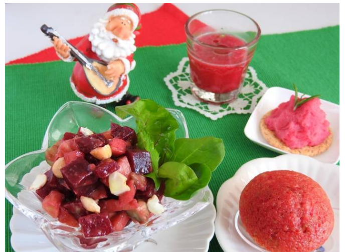
(奥から、スープ、ポテトサラダ、プチケーキ、サラダ)

【ビーツプチケーキ】卵1個、砂糖45g、油20g、ビーツ40gをミキサーで攪拌し、ふるった小麦粉60gとベーキングパウダー2.5gを加えてざっくり混ぜて小さい型数個に入れ、180℃オーブンで11分ほど焼く。